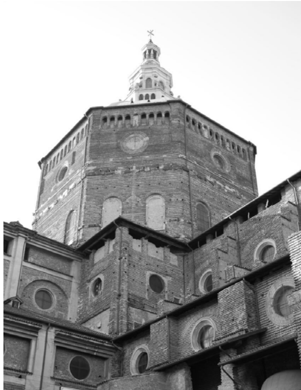
Cattedrale di Pavia

Noi siamo come nani sulle spalle dei giganti.